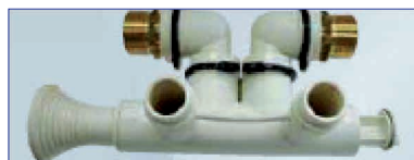
Gruppo by-pass con miscelatore durezza